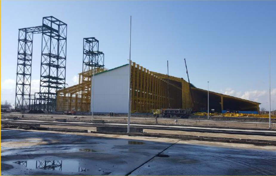
کارخانجات گروه آرین در رشت